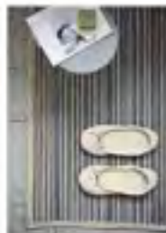
Melange accappatoio bagno e asciugamano

Tonalità che nascono da filati nel tempo, per caratterizzare la spugna in cotone lino a filo con un disegno che esprime movimento attraverso gli intrecci di colore.