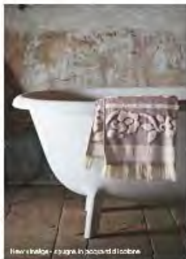
New tubs - bagno in paccard di cobine

Spugna pregiata dalle dimensioni retro da 60 dense e moderne, come girano sul sistema di rullo e tela, conferendo all'aspetto un carattere decisamente contemporaneo. L'effetto è reso ancora più originale dalla finitura a frangito e sotto.