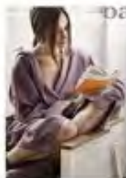
Design Accessori di bagno in cotone pregiato

Spugna pregiata dalle dimensioni retro da 60 dense e moderne, come girano sul sistema di rullo e tela, conferendo all'aspetto un carattere decisamente contemporaneo. L'effetto è reso ancora più originale dalla finitura a frangito e sotto.