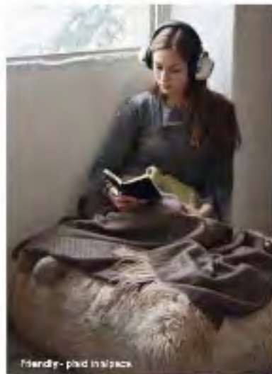
Friendly - pad in alpaca

Leggera e preziosa, l' alpaca evoca mondi lontani. Un vello morbido che scende e accarezza dolcemente con il suo tocco esteso e soffice.