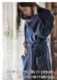
Home - robe in alpaca with photo wall paper

Leggera e preziosa, l' alpaca evoca mondi lontani. Un vello morbido che scende e accarezza dolcemente con il suo tocco esteso e soffice.