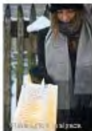
Travel - scarf in alpaca