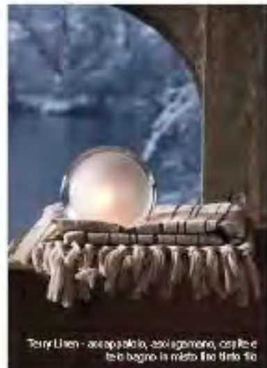
Terry Lino - accappatoio, asciugamano, copile e telo bagno in misto lino lino fib.

L'intreccio del cotone e del lino in i loro colori naturali per una spugna ricca e protetta. Il lino proposto per una spugna leggera che mantiene intatte le migliori doti di assorbimento, per consentire il massimo comfort nei momenti di relax.