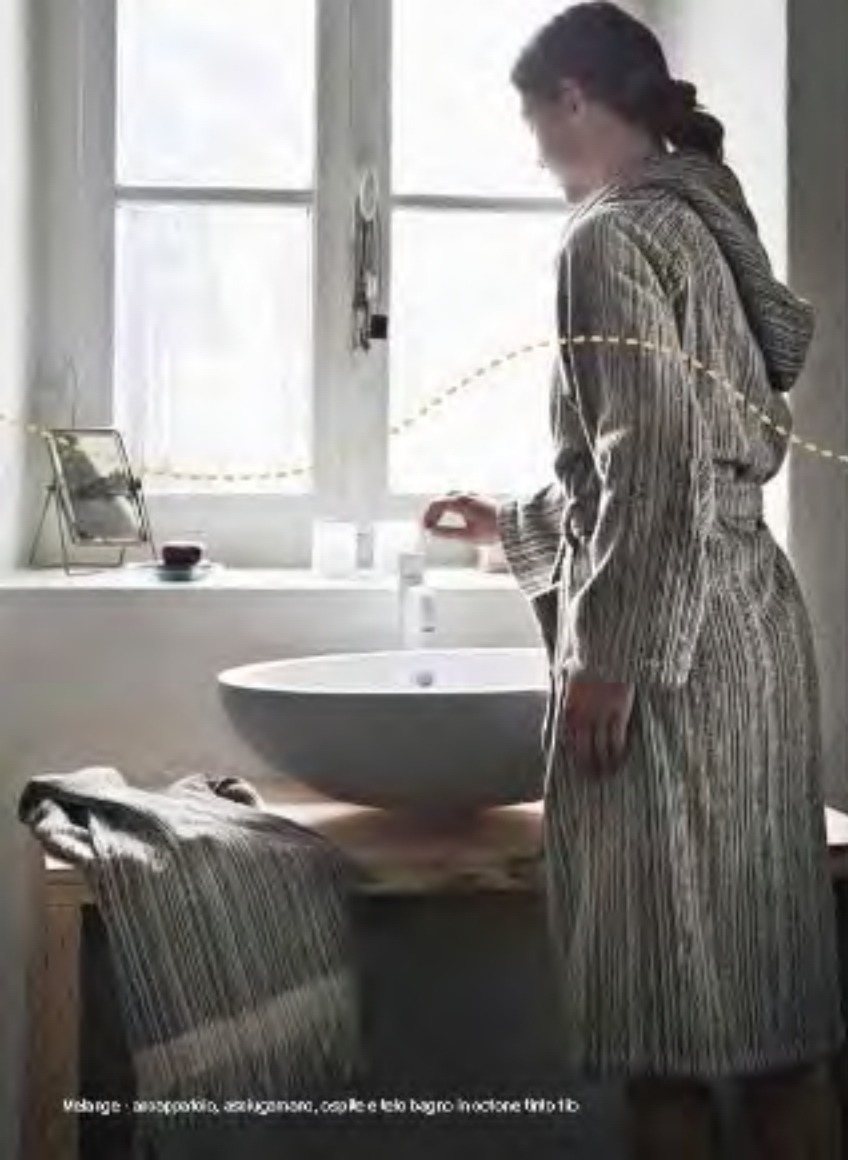
Melange - accappatoio, asciugamano, copile e telo bagno in cotone lino fib.